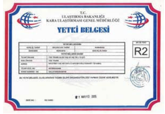
Resim 1.3: Yetki belgesi

Ulaştırma Bakanlığı tarafından firmanın yetki belgesinin iptal edilmesi hâlinde firmaya TIR karne verme işlemi askıya alınarak durum TIR işlemi ve geçiş belgesi dağıtımı yapılan odalara bildirilir.