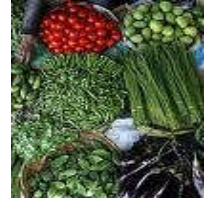
Resim 2.3: Bitkiler

Bitkiler, temizlik malzemeleri, gıda maddeleri, broşürler gibi eşya ve hediye edilen, atılan, bozulan veya dış ülkelerde kullanılan tüketim malzemelerinin ATA karnesi kapsamına alınması mümkün değildir.