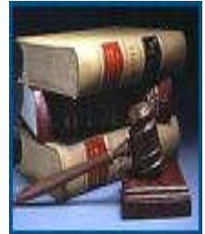
Resim 2.4: Mevzuat