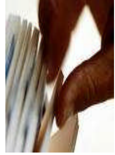
Resim 2.2: Başvuru evrakları