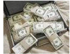
Resim 1.4: Kabul teminatı

TIR sistemine dâhil edilmesini talep eden her aday karne hamili, müracaatı sırasında kabul teminatını sunmak ve teminat miktarında Birlik Yönetim Kurulu kararıyla sonradan yapılacak tüm değişikliklere de riayet etmek zorundadır.