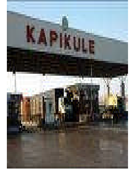
Resim 1.2: Gümrük