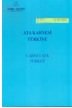
Resim 2.1: ATA karnesi

ATA Sistemi ICC (Milletlerarası Ticaret Odası) bünyesinde bulunan Dünya ATA karnesi Konseyi (WATAC)'nin koordinasyonu altında, kendi ülkelerinde resmî olarak görevlendirildiği beyan edilen kefil kuruluşlar aracılığı ile yürütülmektedir.