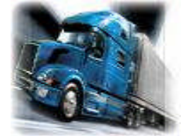
Resim 1.7: TIR sistemi

TIR sisteminin araçları; TIR sözleşmesi, TIR sisteminin prensipleri, TIR karnesidir.