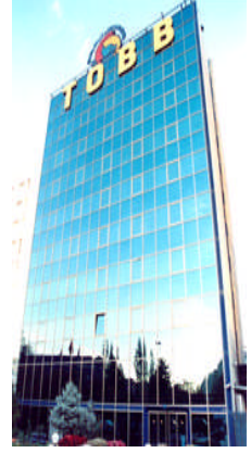
Resim 2.5: TOBB