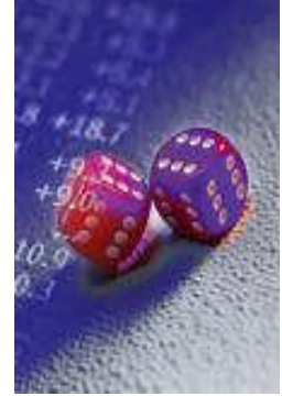
Resim 1.5: Yüksek risk

Kefil kuruluş, TIR el kitabında yer alan hassas ve yüksek riskli eşya teminatı 50.000 - Amerikan doları olarak öngörülmüştür. Buna rağmen, hassas ve yüksek riskli eşya taşınması yapacağını beyan eden karne hamillerinden 20.000- Amerikan doları nakit veya kesin ve süresiz banka teminat mektubu alınır. Ancak; hassas ve yüksek riskli eşya taşınmasında kullanılan bir TIR karnesi nedeniyle, gümrük talebine istinaden alınan teminattan daha fazla bir ödeme yapılması, fazla ödenen miktarın ilgili karne hamilinden tahsil edilememesi ve bu meblağın IRU veya sigortacılar tarafından talep edilmesi hâlinde, talep edilen meblağ birlikçe karşılanır. Ancak; birlik tarafından ödenen meblağ karne hamiline rücu edilebilir.